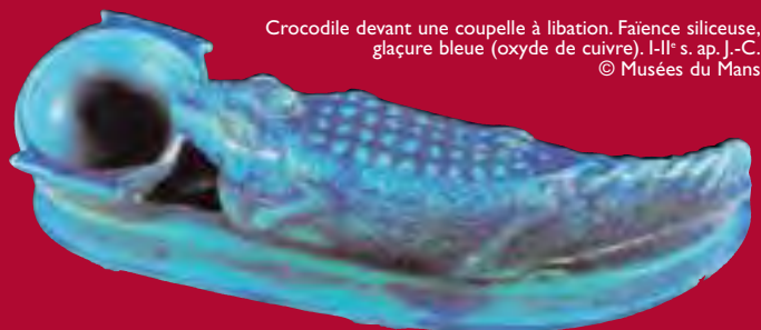
Crocodile devant une coupelle à libation. Faïence siliceuse, glaçure bleue (oxyde de cuivre). I-II e s. ap. J.-C.